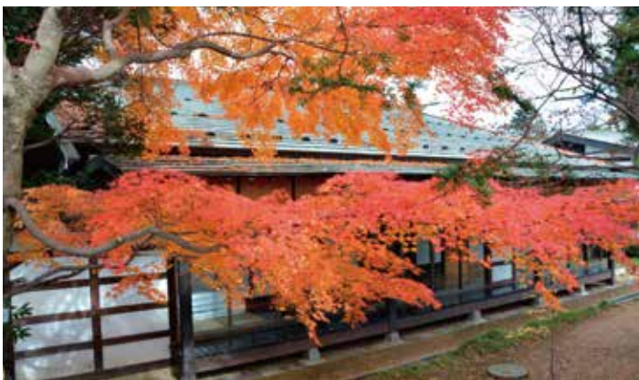
国登録有形文化財 築165年「信州松本 南涯館」